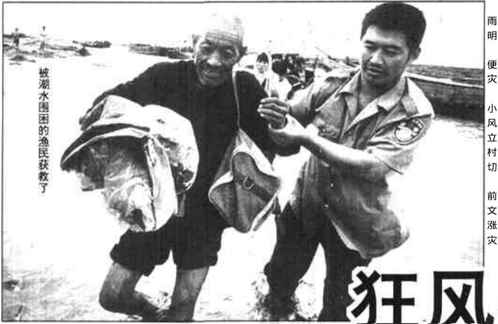
被潮水围困的渔民获救了

存在的问题主要是科学技术研究开发水平不高；科技推广机构人员素质偏低；多元化科技投入的保障机制尚不完善。（马爱国）