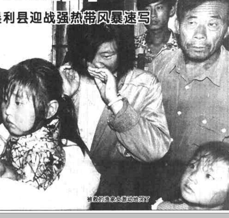
被救的渔家女激动地哭了