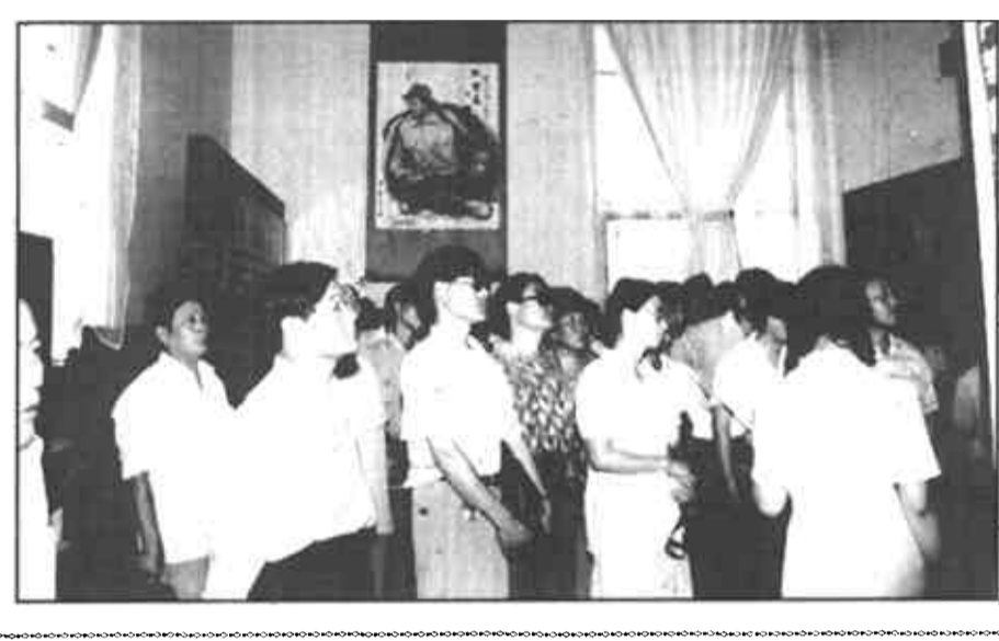
垦利县高盖镇前于村普法注重实施“细胞工程”,利用农民法律夜校,将法律知识送进千家万户,使这个3年前的治安乱村转变为油区一方治安绿洲。

几年来,河口区委、区政府按照“油区治安重中之重”的方针,坚持打防并举,标本兼治,油地结合,联防联治,创造了稳定的油区环境。 河口区是胜利油田的主战场,境内分布面积达70%以上。油田生产点多、面广、线长,油区治安难度大。为了给油田生产创造最稳定的环境,区委、区政府一是加强对油区治安工作的领导,形成了齐抓共管的合力。他们把油区治安这一难点、热点问题作为全区社会治安的重中之重,并列入区委常委会议的固定议题,除经常召开会议进行专题研究外,对出现的新情况、新问题,及时予以研究解决。同时,每季度召开一次重点油区油田单位联席会,交流情况,研究措施,部署工作。为使油区治理工作达到规范化,这个区按照行政区划划分了7个油区治安责任区,区委书记为第一责任人,乡镇、办事处党委书记为直接责任人。同时在全区58个油区村庄派驻工作组,实行了乡镇干部“包平安”责任制,并做到责任明确,奖罚分明。 近两年来,先后对油区治安出现漏洞和问题的2个乡镇予以一票否决,取消其各类先进的评选资格,并对有关(镇)、村负责人给予严重的党纪政纪处分。为达到联防联治,全区各油区乡镇、村庄都与辖区油田单位签订了工农联防协议书,油田出资出设备,地方出人员,在5个油区乡镇的重点油区设立了12个警务区,配备了30余名干警和190余名联防人员。并在主要地点设立了12个油区治安办公室和12处检查站,坚持24小时巡逻检查,对油区实行动态封闭式管理,切实发挥了打击防止犯罪、维护油区秩序的作用。据不完全统计,自去年以来,治安联防队现场抓获盗窃、破坏油田物资、器材的违法犯罪嫌疑人70余名,缴获被盗油田原油240余吨,油管280余根,为国家挽回经济损失650多万元。 (时云杰)